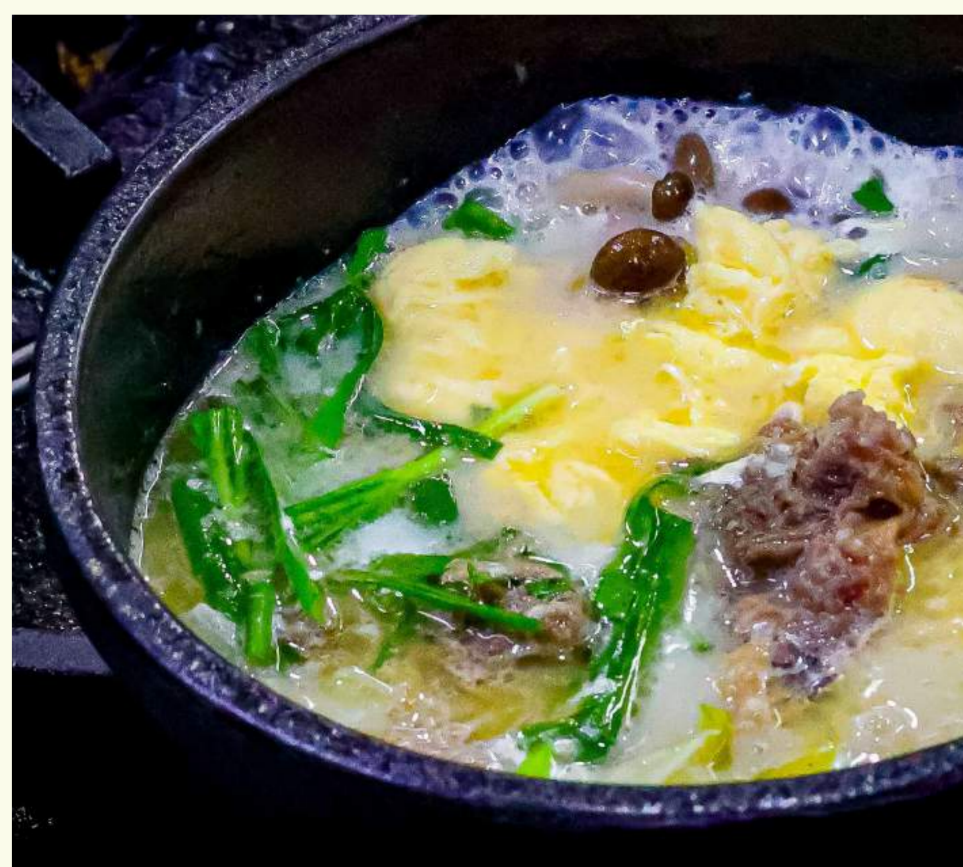
Gomtang Soup / Oxtail Soup