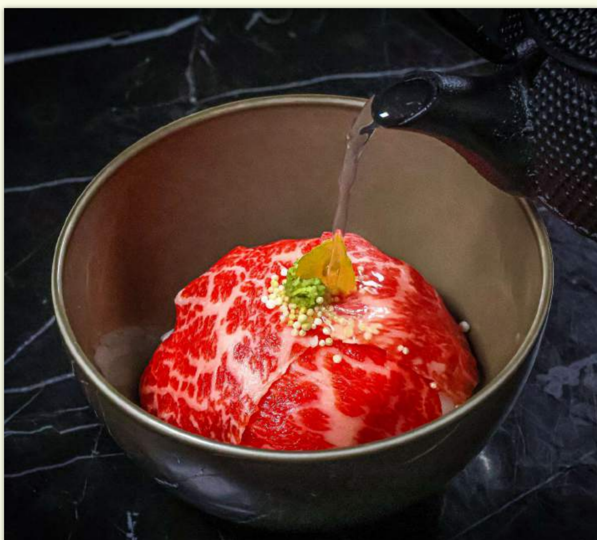
Gyuniku Dashi Chazuke