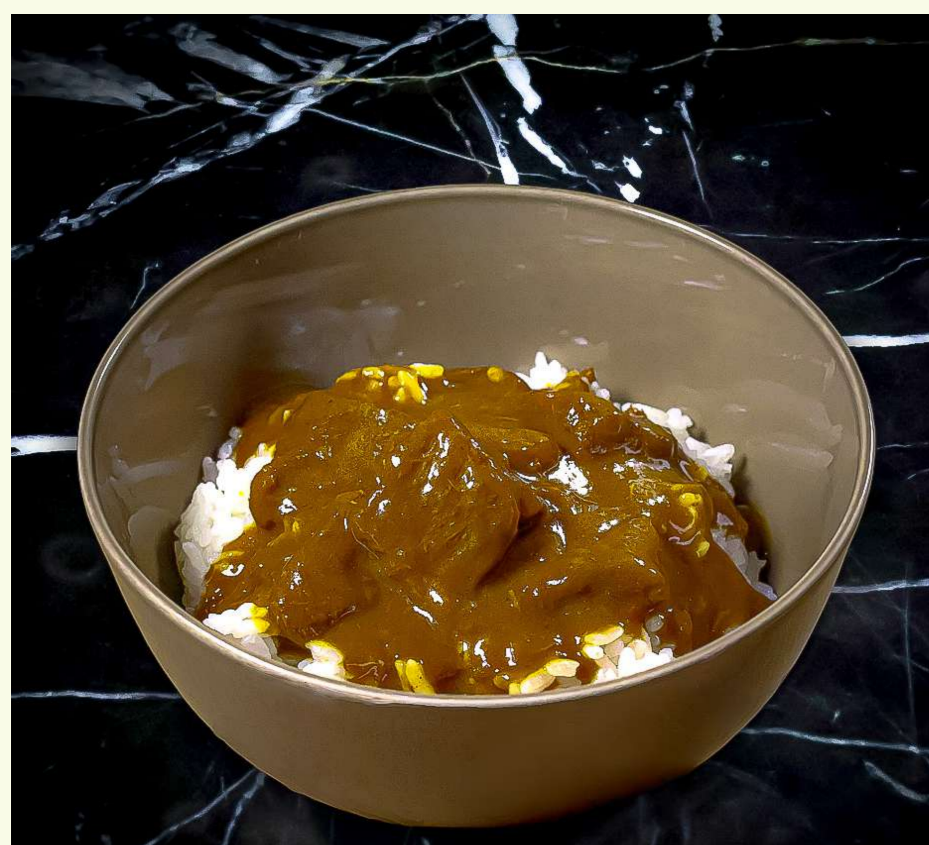
Wagyu Tan Curry